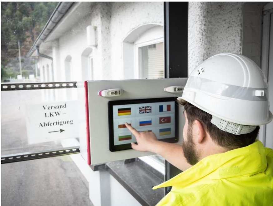
Abbildung 1: Owl Eye® Informationsleitsystem im Einsatz

Das Owl Eye® Informationsleitsystem ist ein innovatives, industrielles Informationsterminal, das entwickelt wurde, um Kommunikationsbarrieren in mehrsprachigen Arbeitsumgebungen effektiv zu überwinden. Durch die Integration moderner Technologien wie der DEEPL API, ermöglicht das System die nahtlose Übersetzung von Inhalten, einschließlich Texten, Bildern und Videos mit Untertiteln, in jede gewünschte Sprache.