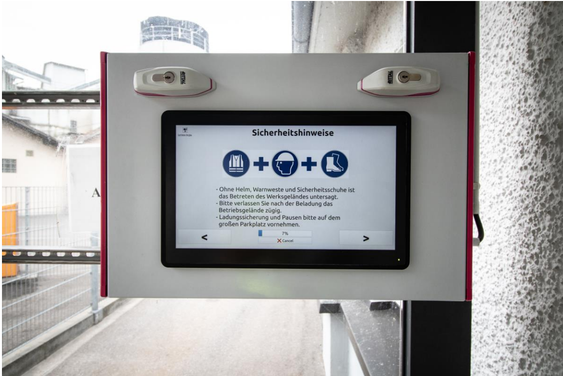
Abbildung 3: Beispiel einer Sicherheitseinweisung mit dem Owl Eye® System